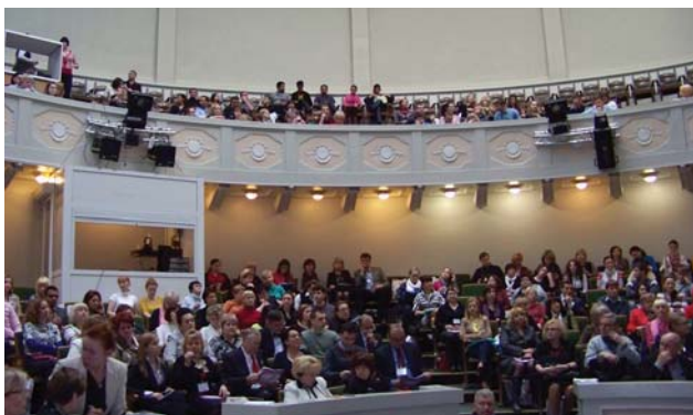
Рис. 1. Зал внимательно слушает лекцию.

жениии двух дней, как лакмусовая бумажка, не только отразили наличие у врачей интереса к проблеме, но и подтвердили верность выбранного нами пути. Опираясь на опыт работы Ассоциации стоматологов Украины, мы глубоко убеждены, что не только учебные семинары, но и научно-практические конференции и конгрессы целесообразно проводить параллельно с выставкой стоматологической продукции. Сегодня это требование времени, это реальная потребность врача одновременно расширить свой профессиональный кругозор и тут же увидеть на стендах разных фирм то, что прозвучало в докладах, возможность приобрести необходимые материалы и инструменты. В связи с этим мы благодарны всем нашим партнерам – компаниям и фирмам, поддержавшим этот научный проект.