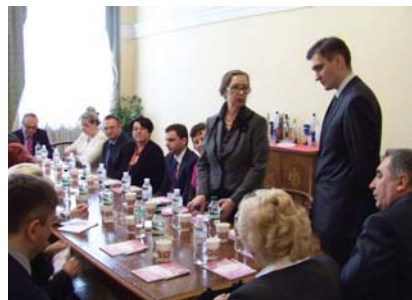
Рис. 7. Подведение итогов конгресса – круглый стол.