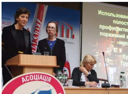
Рис. 6. Выступление почетного гостя конгресса, Президента ЕФР, Дг. Мишель Ренерс (Бельгия).