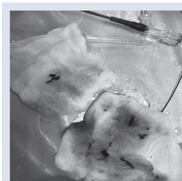
Рис. 2. Макропрепарат, отриманий після тромбекстракції: змішані тромби

Загалом своєчасна реперфузійна терапія у хворих з ішемічним інсультом здійснюється нечасто: тромболітична терапія – у 20 % пацієнтів, а механічна тромбекстракція – менш ніж у 8 % [13]. В описаному клінічному випадку тромболітична терапія була неможливою через наявність абсолютних протипоказань, і тому в якості лікувального методу було обрано механічну тромбекстракцію. Обидва вказані методи лікування за умови їх вчасного застосування статистично значуще зменшують частоту інвалідизації протягом наступних 3 місяців від моменту виникнення мозкової катастрофи (NNT [кількість пацієнтів, що необхідно пролікувати для уникнення одного випадку інвалідизації] – 10 для rt-PA протягом 3 год, NNT – 4 в разі механічної тромбекстракції) [5]. Важливо, що ефективність зазначених методів лікування прямо пропорційно залежить від часу розпочатого лікування, що виправдовує загальноприйнятий принцип лікування ГП – «час – це мозок». Наголосимо, в оновлених рекомендаціях з лікування ГП визнано можливість