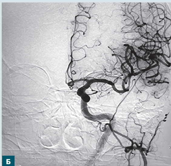
Рис. 1. Результати селективної церебральної ангіографії: А – тромбоз сегмента М1-М2 лівої середньої мозкової артерії; Б – відновлення кровотоку в басейні лівої середньої мозкової артерії після тромбекстракції