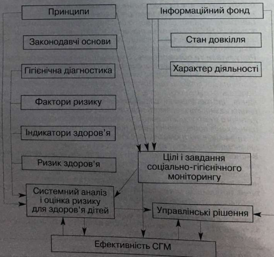
Концептуальна модель соціально-гігієнічного моніторингу здоров'я дітей та середовища їхньої діяльності (Гребняк М.П., 2018)

довкілля, переорієнтація системи охорони здоров'я на пріоритетність профілактичної медицини (рис. 1, 2).