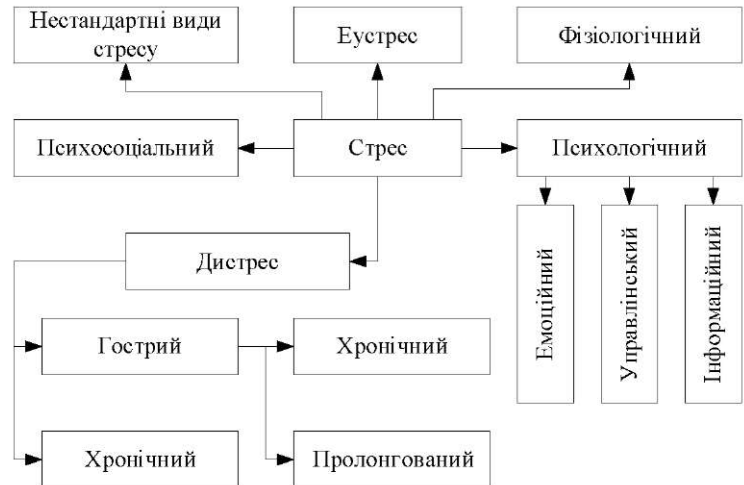
Рис. 1. Класифікація стресу.

Постановка проблеми. Характер стресової реакції, що призводить до адаптації та хвороби, визначається різноманітними факторами: за модальністю - є позитивним і негативним, конструктивним та деструктивним [1].