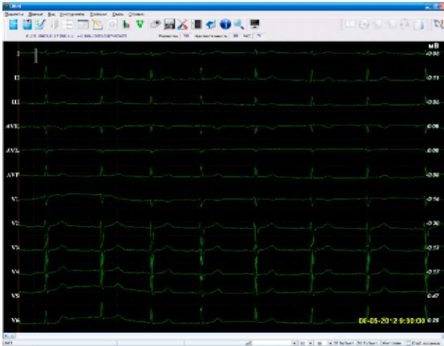
Рис. 2. Головне вікно програми "UNET" із можливістю аналізу результатів електрокардіографії у всіх відведеннях.

Цитологічна експрес-діагностика забезпечується за допомогою мікроскопів із цифровими відеокамерами та програмним аналізом зображення. За допомогою аудіо-відеозв'язку та передачі зображень гінекологічних мазків здійснюється консультування спеціалістами цитологами кафедр патологічної анатомії та клініко-лабораторної діагностики університету із можливістю морфометричного аналізу. У консультативному гістологічному висновку вказується прізвище, ім'я, по батькові пацієнта, вік, стать, № гістологічного (цитологічного) препарату, текст гістологічного висновку або консультативний гістологічний висновок, дата та інформація про лікаря-консультанта. Для проведення морфометричної обробки зображень розроблено програмний засіб в середовищі програмування Delphi 7.0. Для отримання зображення з відеодіагностичної апаратури використо-