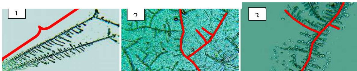
Рис. 1. Параметри дендриту, досліджувані на середньому збільшенні: 1) довжина кристала до місця розгалуження, 2) односторонні галуження, 3) двосторонні галуження.

Отже, пошук шляхів об'єктивізації оцінки зображень, отриманих при дослідженні кристалізації слини, є актуальним. На наш погляд, для повної кількісної характеристики мікрокристалів необхідно розробити алгоритм дослідження мікрокристалограм: на малому збільшенні ( \times 40 ) вибрати основний шар фації (рис. 1); виділити фрактал; визначитися із загальною