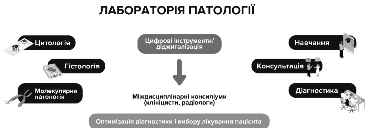
Рис. 1. Цифрові інструменти в оптимізації роботи патоморфологічної лабораторії

Дистанціювання та обмежений фізичний доступ до матеріальних ресурсів у медичній сфері потребують впровадження ефективних механізмів дистанційної взаємодії. З цієї позиції оптимальним рішенням є впровадження цифрових інструментів, які уможливають дистанційну роботу з будь-якої точки світу (рис. 1). Протягом останніх десятиліть цифрові інструменти стрімко впроваджувалися у різні сфери охорони здоров'я [24, 27]. Одним із найбільш яскравих прикладів є радіологія, де технологічні зміни призвели до прориву в розвитку цієї сфери медицини [8]. Проте окрім суто клінічної сфери, цифрові інструменти стрімко увійшли в практику патоморфологічних лабораторій у всьому світі [16, 19]. Удосконалення мікроскопічної техніки та комп'ютерних технологій на тлі еволюції цифрових камер визначило розвиток протягом останніх 20 років направлення цифрової патології [19, 21]. Хоча в світі цифрова патологія набуває обертів, її впровадження в Україні обмежене в силу низької обізнаності, довіри та певних технологічних аспектів.