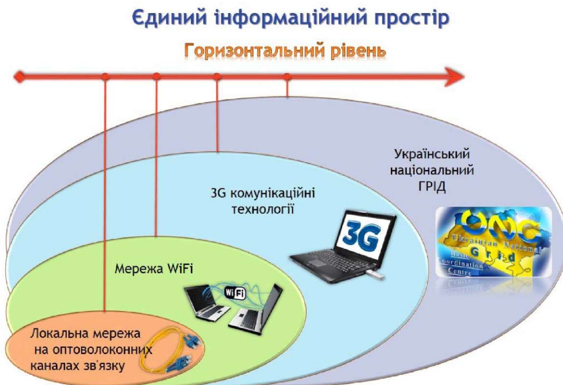
Рис. 2. Горизонтальний базовий рівень структурної організації комп'ютерних мереж.

Наступний, четвертий рівень інтеграції, впроваджується у випадку необхідності проведення великого обсягу наукових обчислень, це підключення серверного кластера університету до ГРІД-мережі (система кластерів високопродуктивних серверів наукових та навчальних закладів України, об'єднаних високошвидкісними мережами у багатопроцесорний суперкомп'ютер).