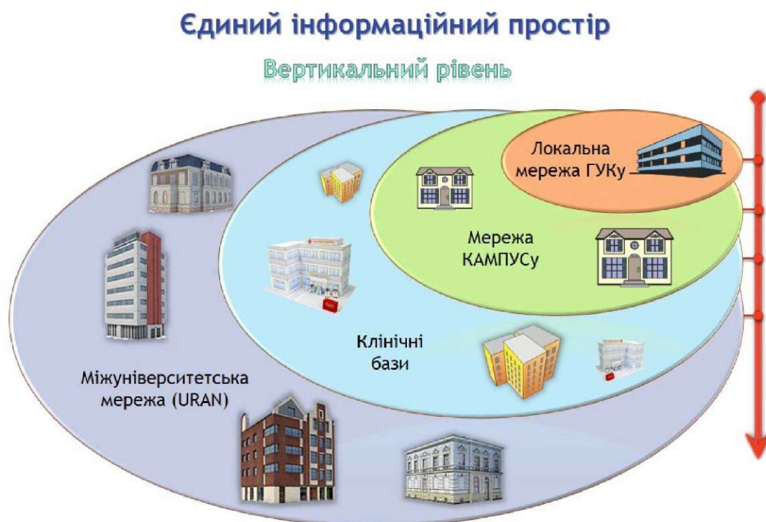
Рис. 1. Вертикальний базовий рівень структурної організації комп'ютерних мереж.

Результати та їх обговорення. Розглянемо детально структурну організацію комп'ютерних мереж (КМ) ВМ(Ф)НЗ (рис. 1).