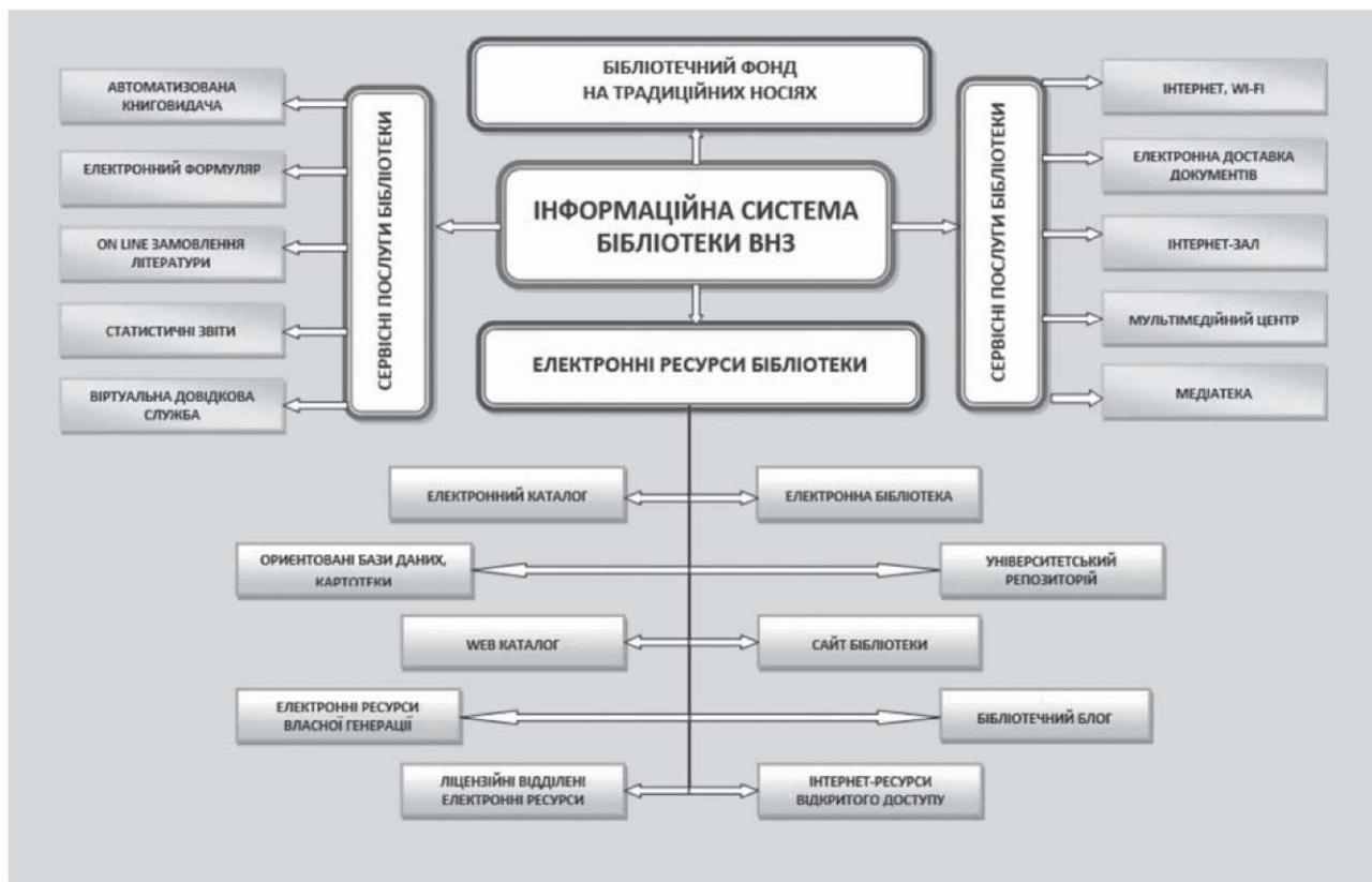
Рис.4. Типова інформаційна система бібліотеки ВМ(Ф)НЗ.

Основні характеристики автоматизованої бібліотеки ВМ(Ф)НЗ: