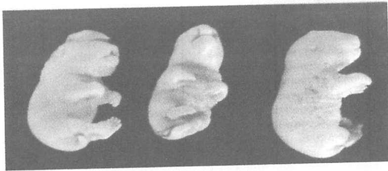
Рисунок. Врожденные пороки развития у зародышей сирийских хомячков основной группы на 15-й день внутриутробного развития. Фиксация в смеси Буэна. Слева направо: экзенцефалия и расщелина верхней губы и твердого неба; двухсторонняя расщелина верхней губы; черепно-мозговая грыжа

В популяции сирийских хомячков, использованных в работе, существует предрасположенность к возникновению врожденных пороков развития, о чем свидетельствуют 2 случая возникновения указанных пороков в контрольной группе.